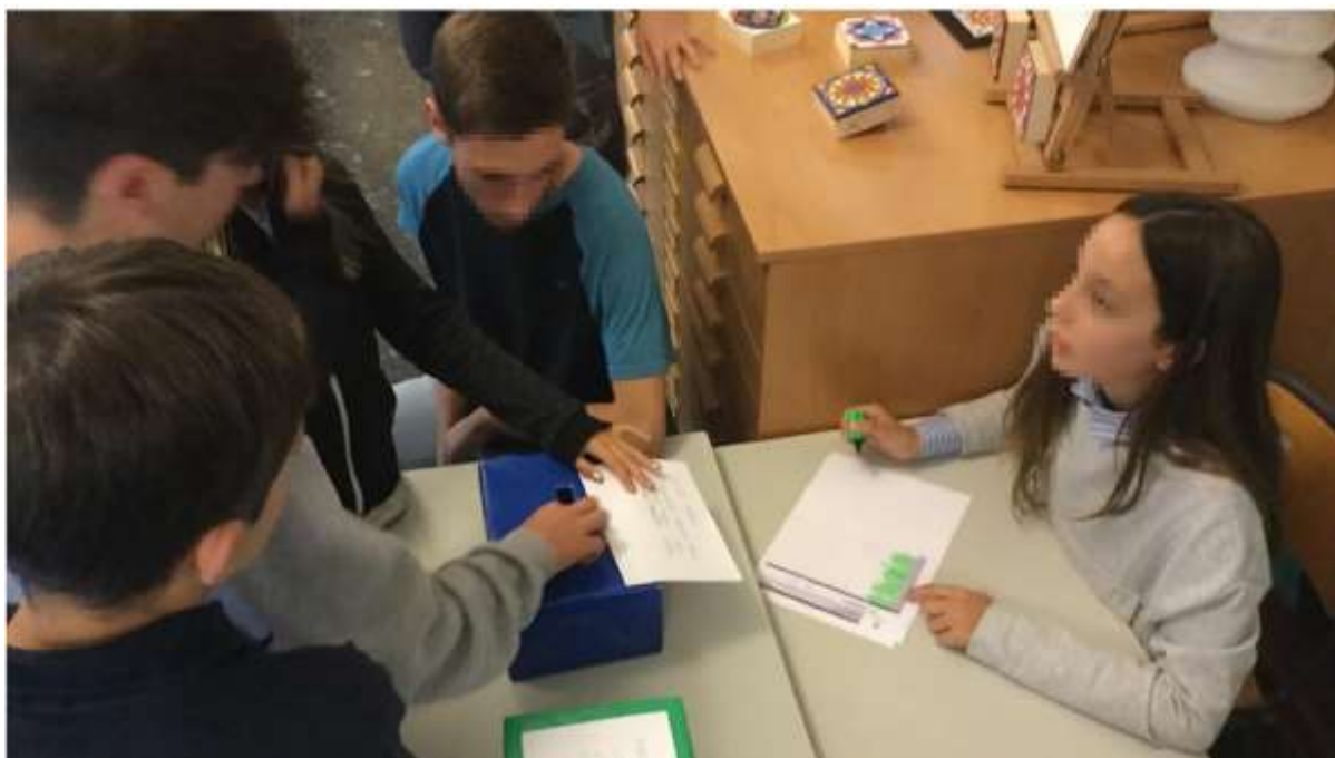
Formar-se vivint la democràcia. Alumnes votant el Consell de Govern d'una escola.