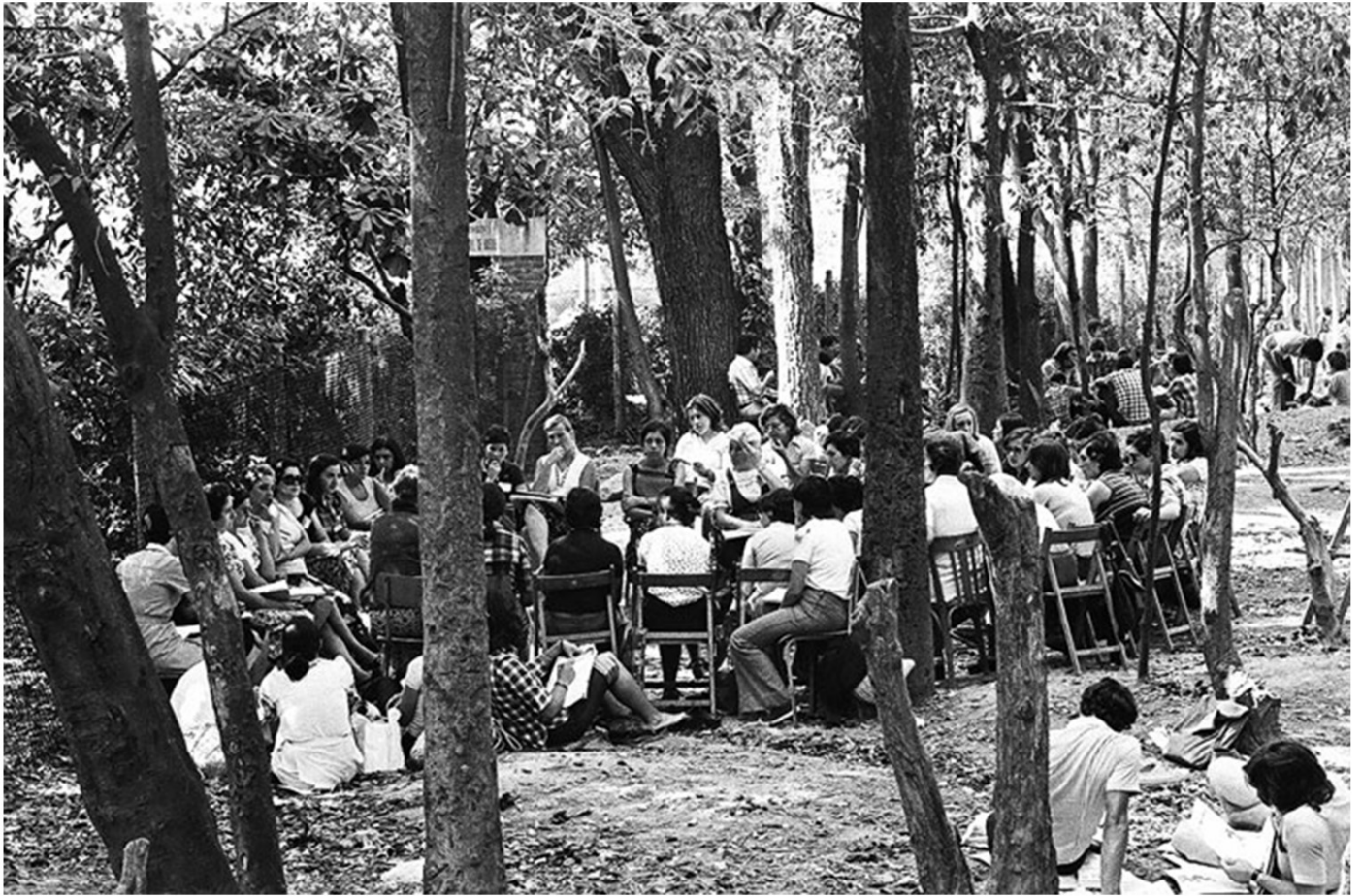
Escola d'Estiu de 1968. Educant per a la democràcia en una dictadura.